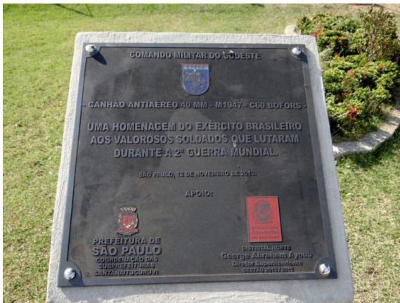
2) Canhão doado pelo Exército

Baldwin Lima – Hamilton-Corp. Heat 542 D WGT 10,700 LBS DIA 11'-0" PITCH AT 7 RAD 12'-0" DWG DD 384 S44-23 ALT-2A LLOYDS 8221